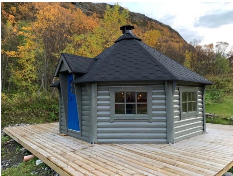
Denne står i Sandvågen, Skjervøy