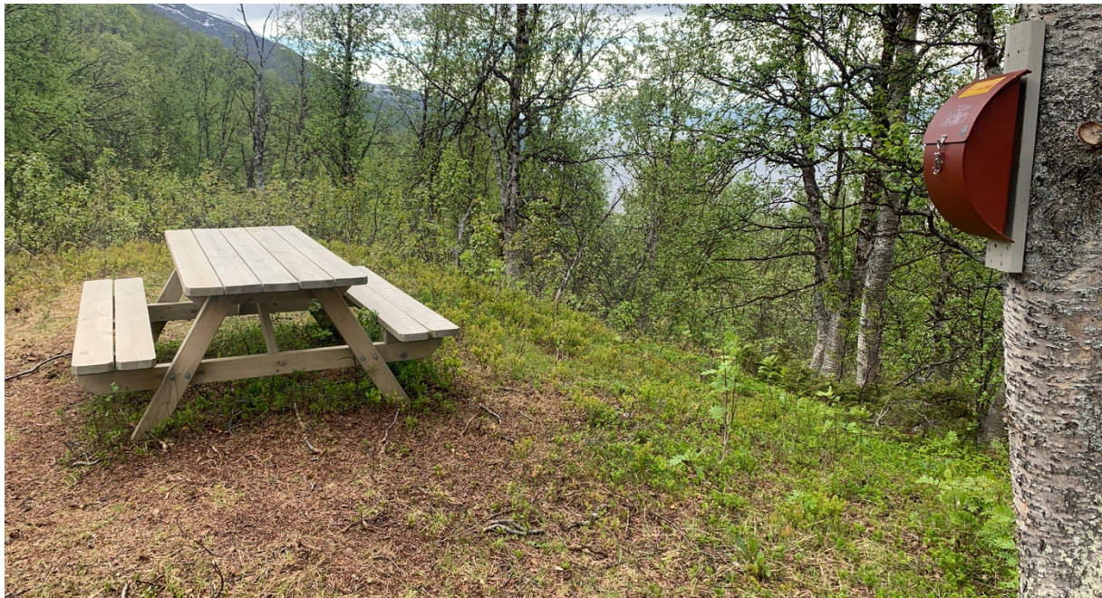
Mange turer i Kåfjord har fått utplassert bord og benk, som her på Storbakken, Djupvik.